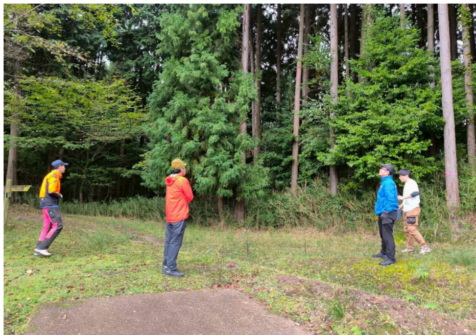
現地の準備の様子と 最終下見