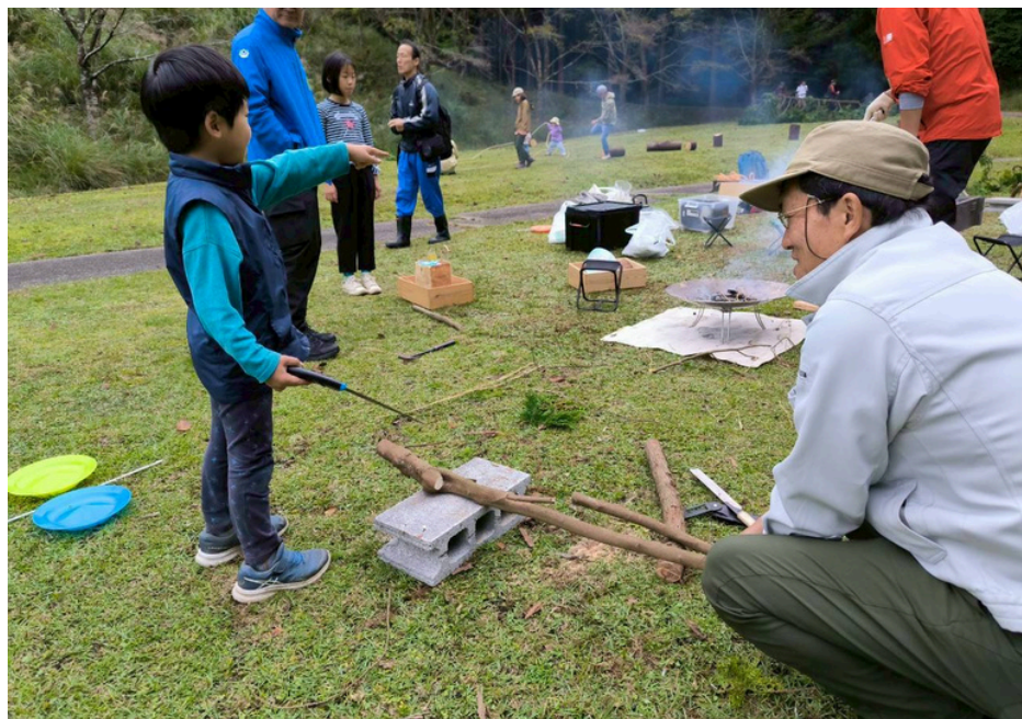
たき火エリアの様子②