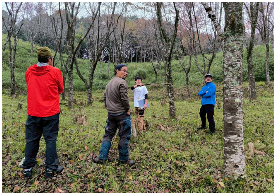
現地の準備の様子と 最終下見 森の遊びエリア