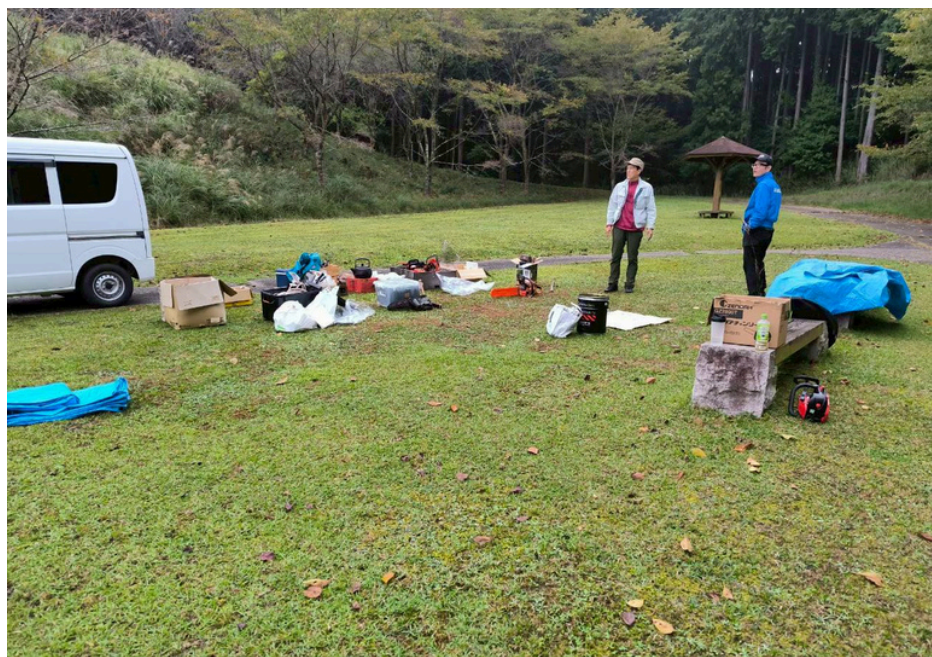
現地の準備の様子と 最終下見