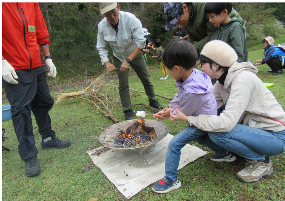
たき火エリアの様子①