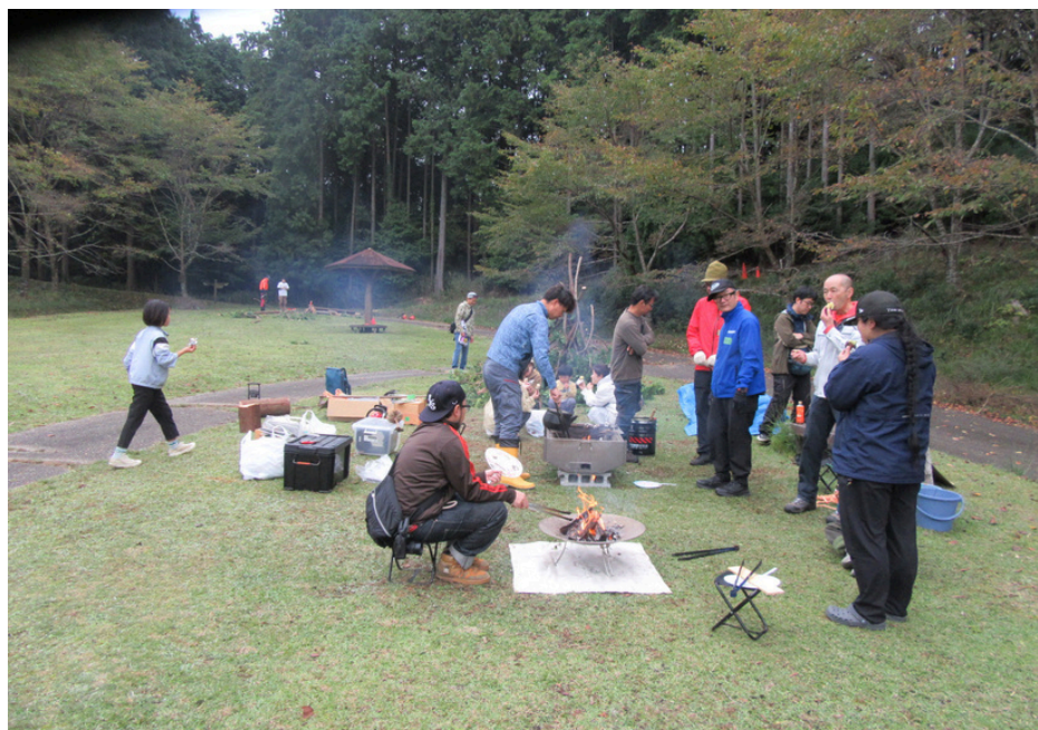
たき火エリアの様子③

全体の様子 手前がマッチの練習用の小たき火台 奥が大きな火を楽しむBBQ台のたき火